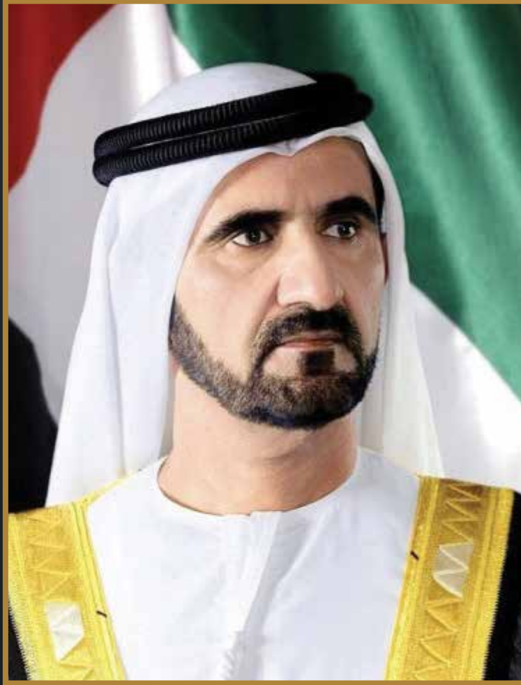
صاحب السمو الشيخ محمد بن راشد آل مكتوم نائب رئيس الدولة رئيس مجلس الوزراء حاكم دبي

HH SHEIKH MOHAMMED BIN RASHID AL MAKTOUM Vice-président, Premier Ministre des Émirats Arabes Unis et Souverain de Dubaï